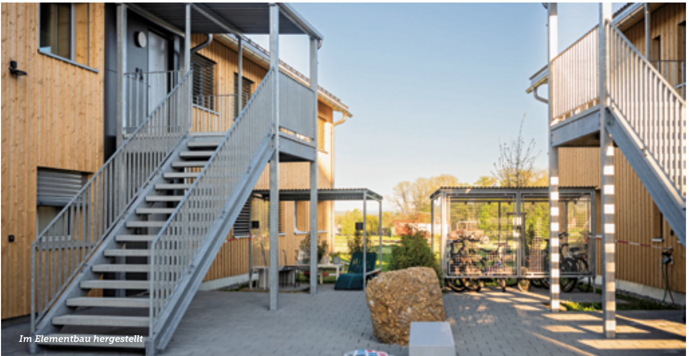
Im Elementbau hergestellt