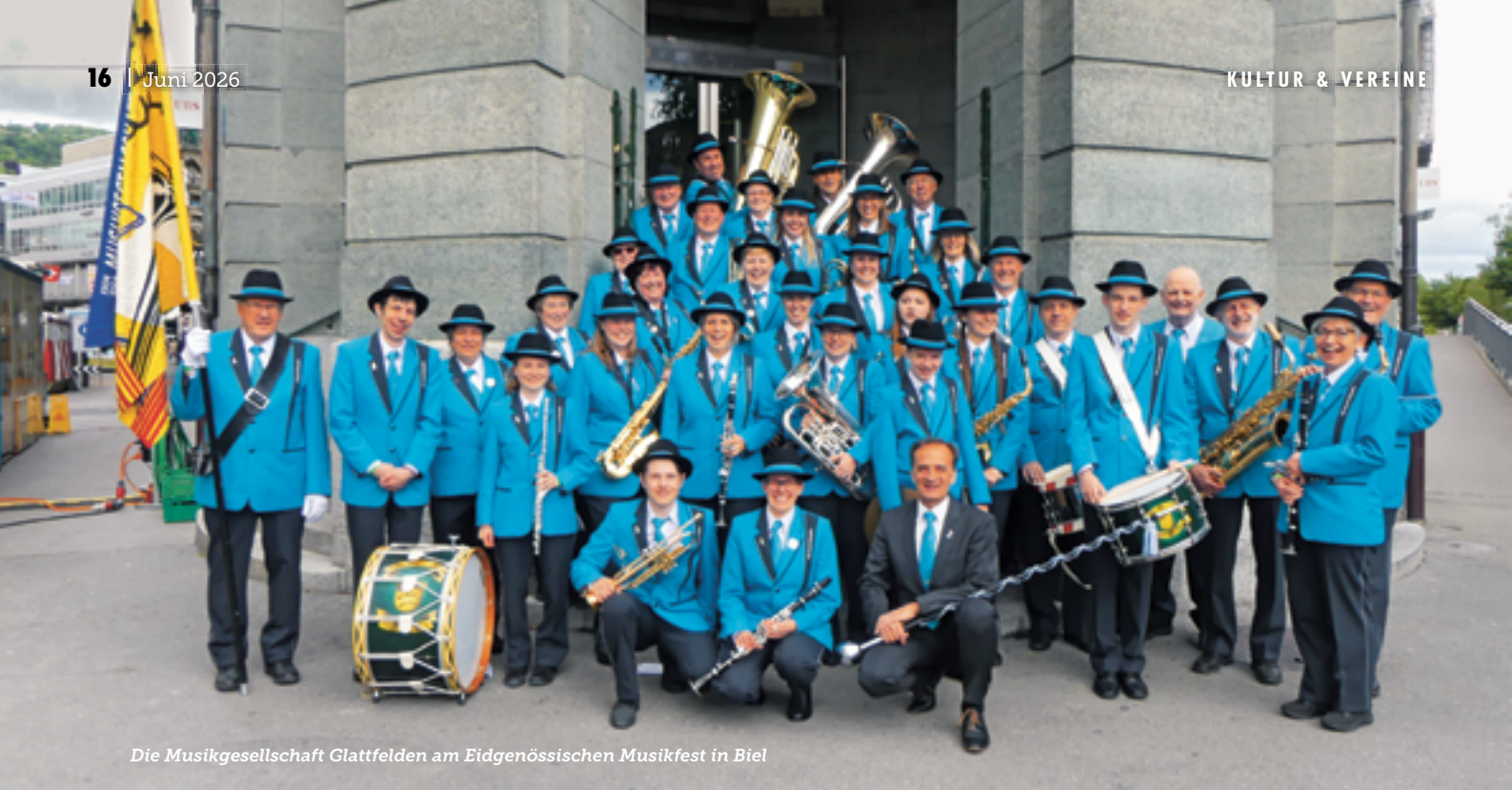
Die Musikgesellschaft Glattfelden am Eidgenössischen Musikfest in Biel