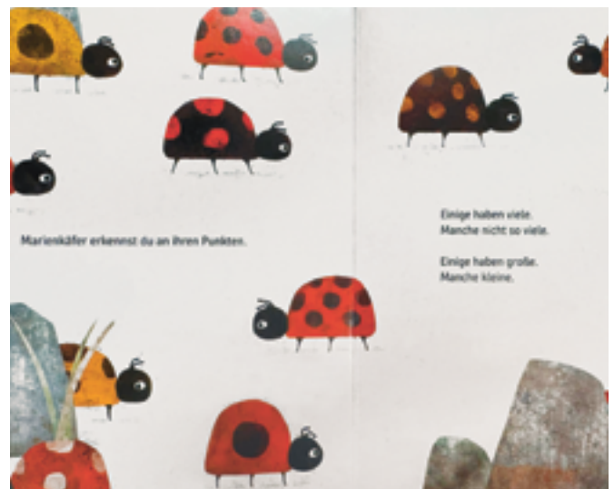
Ein Blick ins Buch «Vom Glück, besonders zu sein»