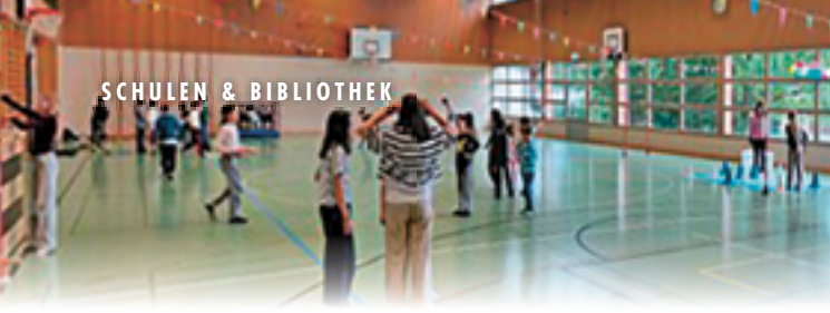
Spielchilbi in der Mehrzweckhalle