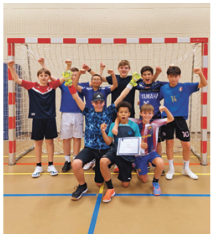
Damals waren sie noch komplett und erfolgreich (Vorrunde Futsal 2024).