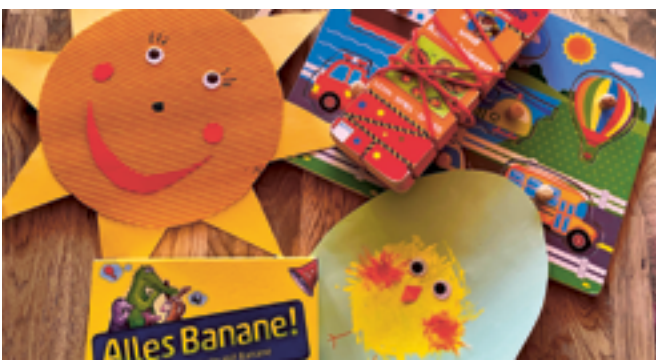
Spielen und basteln an unserem mikile-Morgä.

Ein echter Dauerbrenner in den Wintermonaten ist unsere Offene Turnhalle. An zwei Sonntagvormittagen im Januar und im März wurde die Mehrzweckhalle zur Bewegungslandschaft für Kinder von 0 bis 8 Jahren. Klettern, schaukeln, balancieren oder einfach herumtoben – hier konnten sich alle nach Lust und Laune austoben.