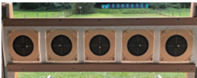
Offen und flexibel. Selbst Biathleten sind bei den Sportschützen willkommen.