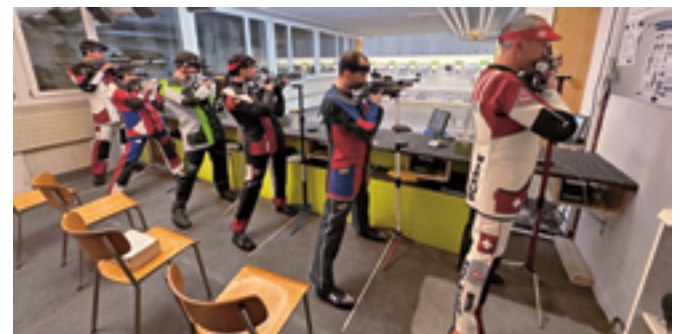
Zwar nicht der Final vom Sommercup, aber die spannende Partie zwischen Glattfelden und Uster im Rahmen der Züri-Liga.

Wer glaubt, dass die Luft in der 10-m-Anlage draussen ist, der irrt sich. Eine Trainingsgruppe zieht unsere Winterdisziplin auch im Sommer durch. Sie wollen die Technik verfeinern und tiefer in die Details eintauchen. In einer Disziplin, in welcher eine einfache 10 nicht ausreicht, um weit vorn zu sein, liegt eine Sommerpause kaum mehr drin, wenn man den Anschluss nicht verpassen will. Mit dem Glarner Sommercup – 5 Heimrunden und einem attraktiven Final in Näfels – kann man zudem die Wettkampf-Erfahrung steigern und das Gelernte immer wieder verifizieren.