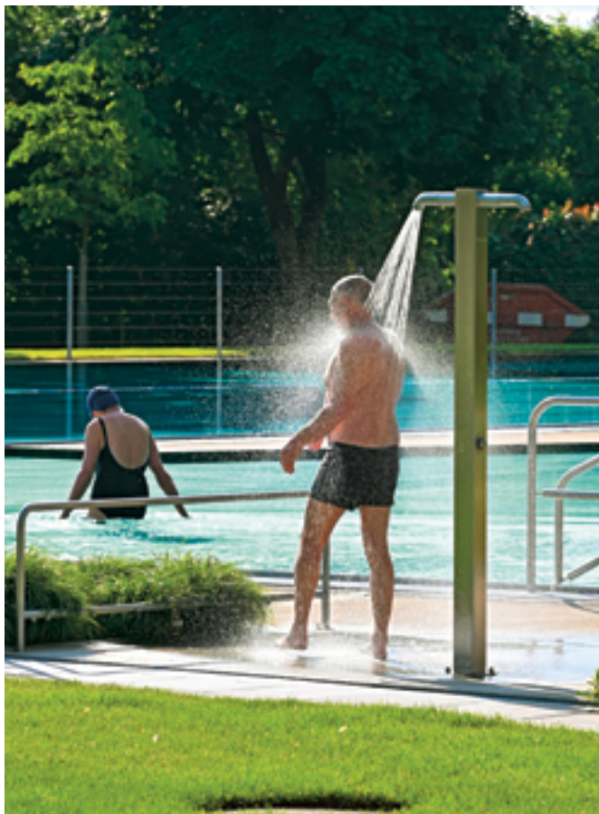
Unter der Dusche wurde nochmals tief durchgeatmet, bevor es ins 18 Grad kühle Wasser ging.