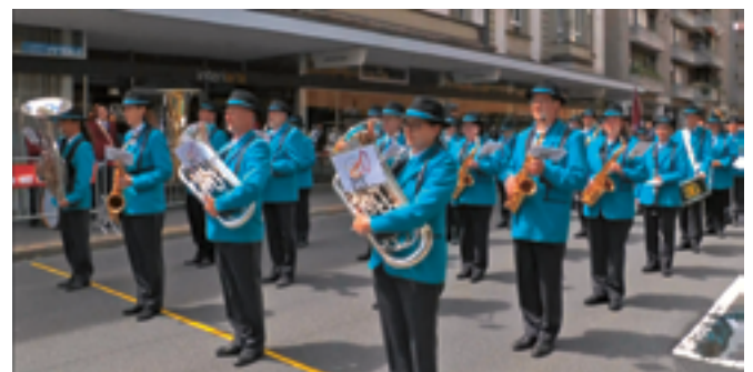
Konzentration, Präzision und musikalische Freude

Wenig später wurde auch das Resultat bekannt gegeben: Mit unserer Darbietung erreichten wir starke 82 Punkte. Bravo, MGG!