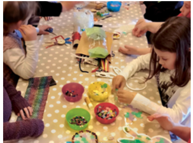
Ein tolles Bastelangebot erwartete die Teilnehmenden.

Kunterbunt wurde es kurz vor Ostern beim Osterbasteln im Kulturzentrum. Mit viel Liebe hat unser OK-Team kreative Ideen vorbereitet, die bei den Kindern für leuchtende Augen sorgten. Es wurde geschnitten, geklebt und gestaltet – und am Ende konnten alle stolz ihre kleinen Kunstwerke mit nach Hause nehmen. Der gemeinsame Zvieri mit Hasen-Guetzli und frischen Früchten rundete den Nachmittag perfekt ab.