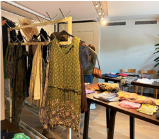
Tolle Waren im Tauschangebot!

Die Grünen Glattfelden organisieren seit einiger Zeit jährlich einen Kleider- und Accessoires-Tausch. Dies ist ein Anlass, der ganz bewusst einfach und unkompliziert gehalten ist. Im Mittelpunkt stehen das gemeinsame Zusammenkommen, Austauschen und Wiederverwenden. Während des Anlasses sind das Kaffee und die Bar des Gottfried-Keller-Zentrums geöffnet. Besucherinnen und Besucher können sich mit kleinen Speisen und Getränken verköstigen, gemütlich plaudern und in entspannter Atmosphäre stöbern.