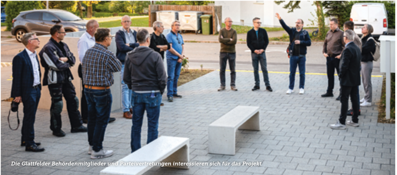
Die Glattfelder Behördenmitglieder und Parteivertretungen interessieren sich für das Projekt