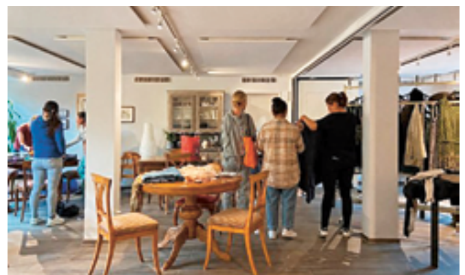
Beim Stöbern findet manch gutes Stück eine neue Besitzerin.