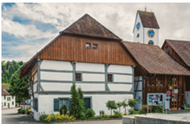
Frischer Projektwind im 500-jährigen Gebäude, in dem seit 1985 auch das Gottfried-Keller-Dichtermuseum mit einer Ausstellung zuhause ist.