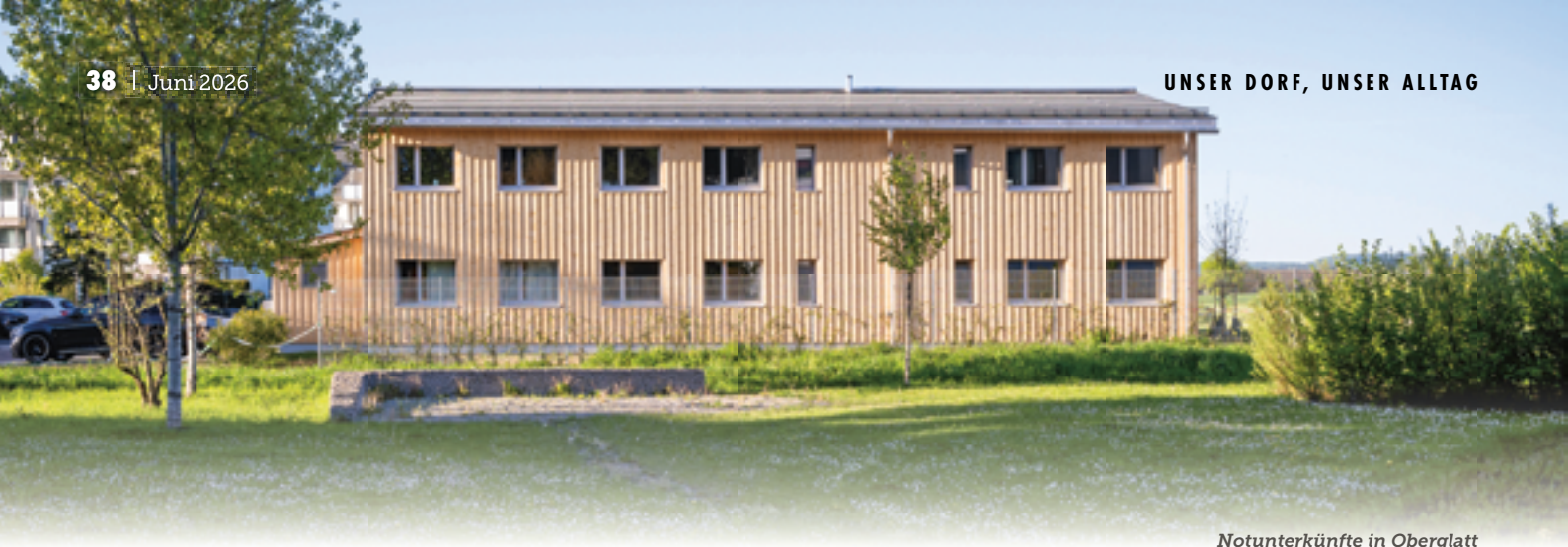
Notunterkünfte in Oberglatt