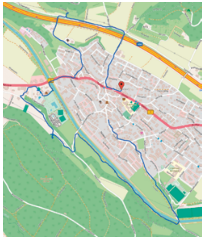
Wanderroute: Mittelpunkte Glattfeldens

Teil zwei und drei finden Sie in der Glattfeldner-App