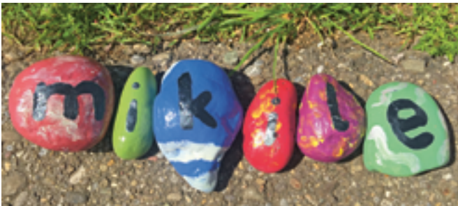
Tolles Vereinsprogramm von unserem Familienverein.