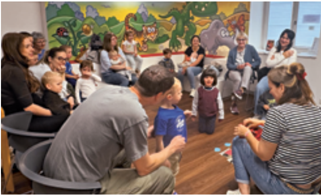
Viele kleine und grosse Besucher:innen

Lilu ist ein Marienkäfer. Doch sie ist anders als alle anderen. Auf ihren Flügeln fehlen die typischen Punkte und genau das macht sie unendlich traurig. Wie Lilu lernt, dass Anderssein auch etwas ganz Besonderes sein kann und sogar Vorteile mit sich bringt, erfuhren die kleinen Besucher:innen am «Bücherbär» vom 5. Mai in der Bibliothek.