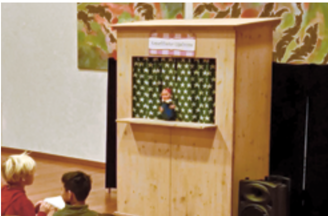
Der Kasperli sorgte für viele freudige Gesichter.

Den Auftakt machte im Januar das Kasperltheater Gigelisuppe im Kulturzentrum Glattfelden. Beim Stück «Kasperli und de Winter wo nöd wett cho» wurde gelacht, mitgefiebert und gestaunt. Der Saal war gut gefüllt und die Kinder hatten sichtlich Freude. Und was darf natürlich nicht fehlen? Genau – Popcorn in der Pause!