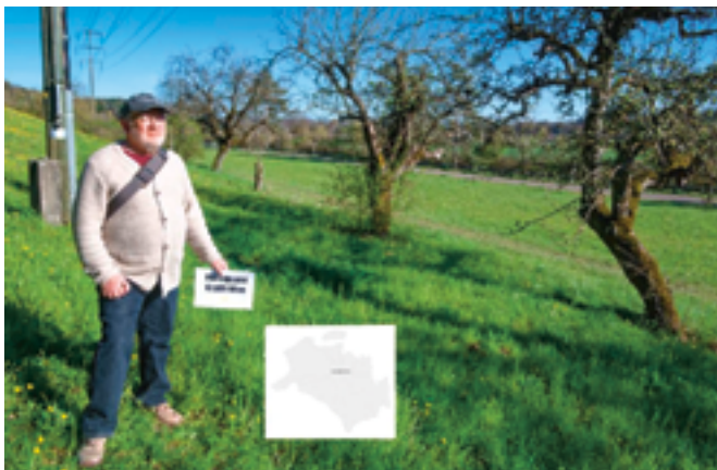
2. Mittelpunkt: minimaler Abstand zur Grenze

Kurz vor der Brücke Berghaldenstrasse gelangt man zur nächsten Mitte Glattfeldens. Hier hat man, vereinfacht gesagt, summarisch den kürzesten Weg zu jedem Punkt entlang der Grenze. Dieser Mittelpunkt liegt in einer Wiese, hinter einzelnen Obstbäumen, nahe dem letzten Strommast vor der Brücke.