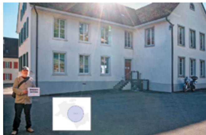
1. Mittelpunkt: der des grösstmöglichen Kreises im Gemeindegebiet

punkt des Gemeindegebietes Glattfelden: jener nach der Methode des grösstmöglichen innerhalb des Gemeindegebiets zu platzierenden Kreises.