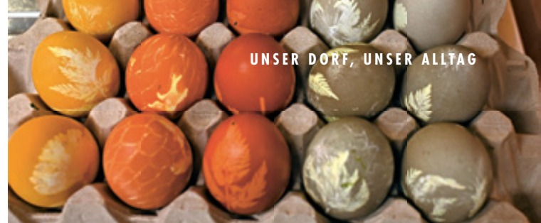
Reihe für Reihe entstehen Muster aus Kräutern und Farben.

Zurück im Stübli werden die Eier sorgfältig vorbereitet. Frisch gesammelte Kräuter liegen in der Mitte des Tisches. Ein Blatt wird behutsam auf das Ei gelegt, anschliessend mit einem Stück Strumpf straff umwickelt und festgebunden. Die so präparierten Eier werden in die Küche zu Maya und Andrea gebracht, wo diese im Sud gefärbt werden. Nach dem Abkühlen packen sie die Eier aus. Zum Vorschein kommen naturnahe Muster. Jedes Ei ist ein Unikat.