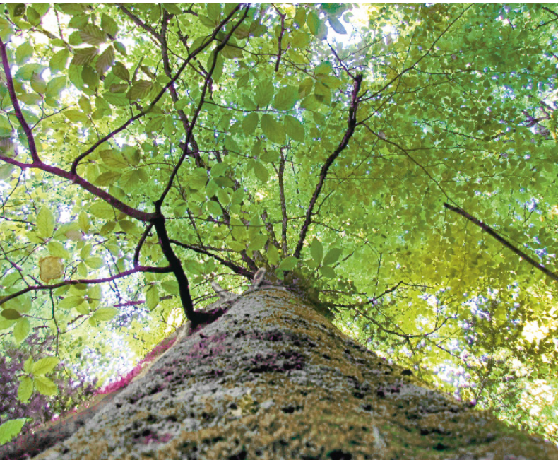
Buche im Sommer