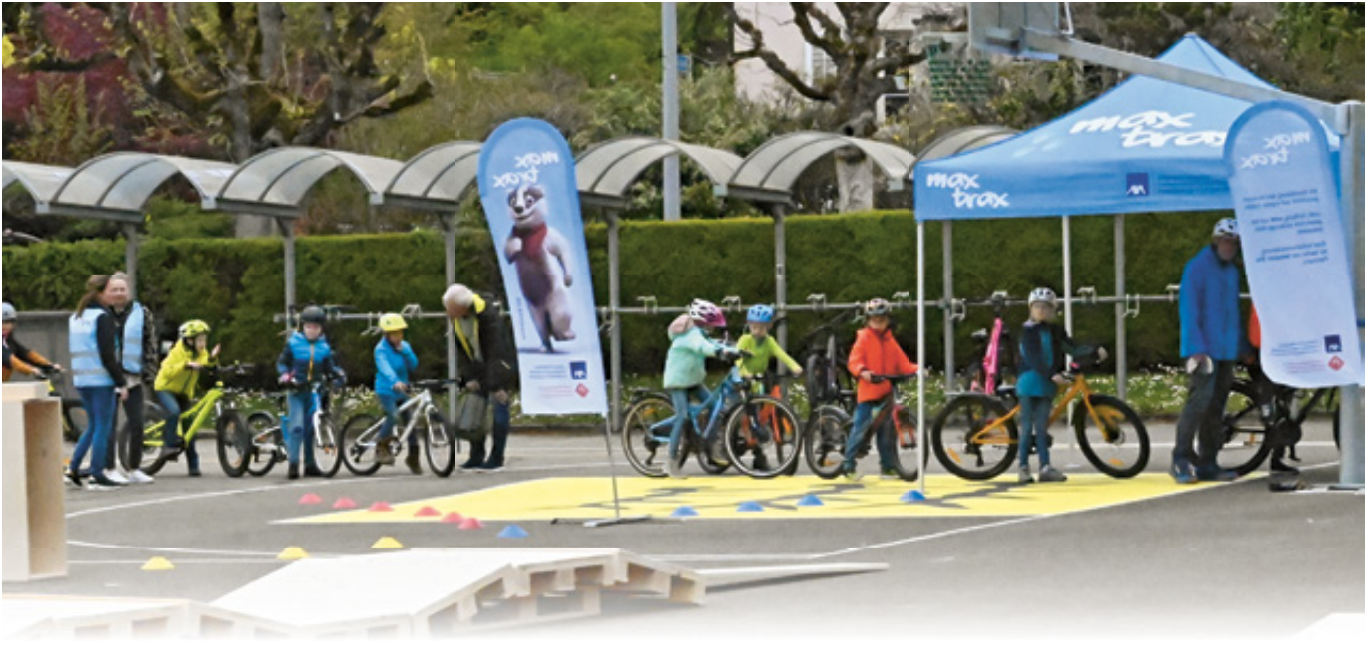
Volle Fahrt voraus: Der Pausenplatz wird zur Übungszone.