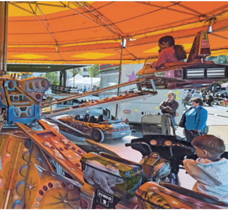
Hier dreht sich alles, ausser die gute Laune.