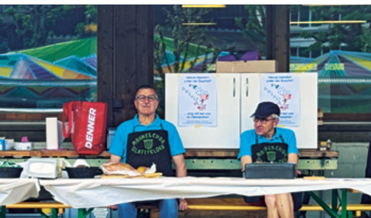
Vor dem Ansturm: eingespieltes Männerchor-Team in Bereitschaft.