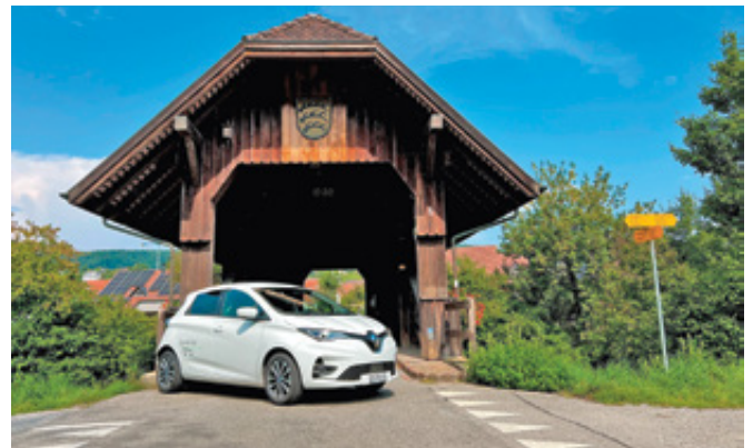
Mit dem Renault Zoé spontan unterwegs, hier vor der Hegstenbrücke