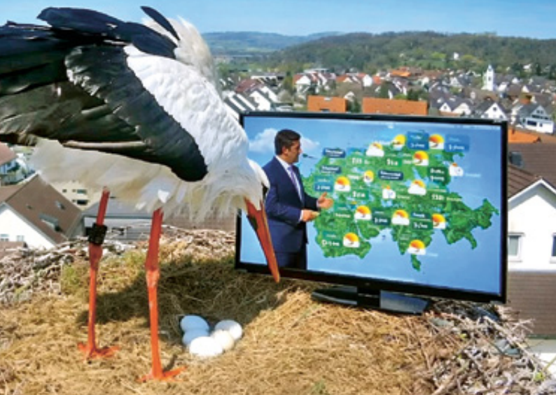
Storchencam, durch KI interpretiert