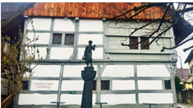
Das «graue Haus» wird 500 Jahre alt.

Zur Phase A zählt der Ist-Zustand. Erni erwähnt die positiven Aspekte – funktionierender Stiftungsrat, funktionierende Kultur- und Galeriekommission, das Haus in Top-Zustand mit guter Infrastruktur samt Kafi und Saal und dem im Wanderwegnetz integrierten Dichterweg. «Leider haben wir aber wenig Besucher und einen schwachen Bekanntheitsgrad.» Zudem gehe der Mitgliederschwund altersbedingt weiter. Für die Phase B ist eine Mitmachveranstaltung vorgesehen, bei welcher sich anschliessend die Möglichkeit ergibt, in einer zeitlich begrenzten Projektarbeit mitzuarbeiten. In der Phase C soll eine Auswertung erfolgen und eine Spurgruppe eingesetzt werden. «Dann geht es konkret um mögliche Umsetzungen», sagt Erni.