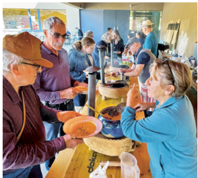
Die Beiz läuft auf Hochtouren.