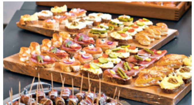
Mathilde Erni und Vreni Lauffer haben für die Gäste einen reichhaltigen Apéro vorbereitet.