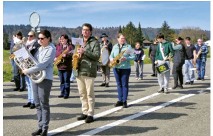
Auch für den Parademusik-Auftritt wird fleissig geübt