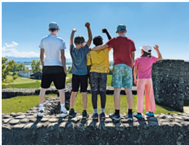
Reisli an den Pfäffikersee