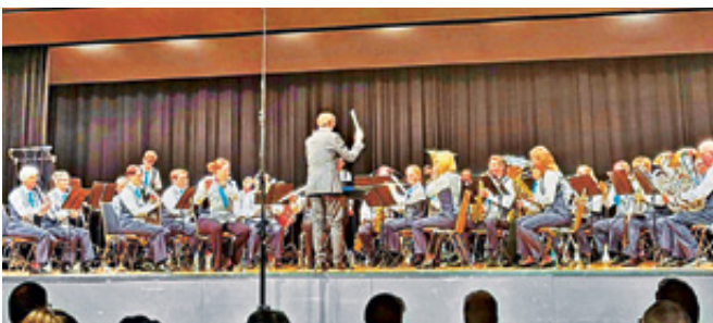
Erstes Vorspiel vor einer Jury am Vorbereitungskonzert vom 11.4.2026 in Bülach

Nach dem Wettspiel reisen wir übrigens nicht direkt nach Hause – nein, wir fahren nach Porrentruy und hängen noch zwei erlebnisreiche Tage im Jura an. Auch abseits der Bühne geniessen wir die gemeinsame Zeit mit verschiedenen Ausflügen, und natürlich wird die Geselligkeit auch nicht zu kurz kommen.