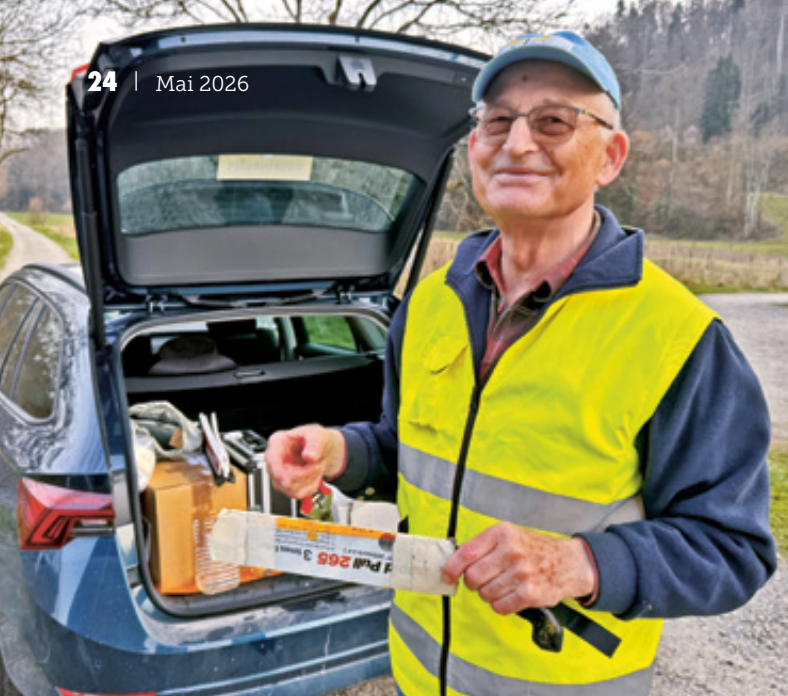
Mit Werkzeug im Kofferraum und einem Lächeln im Gesicht im Einsatz.