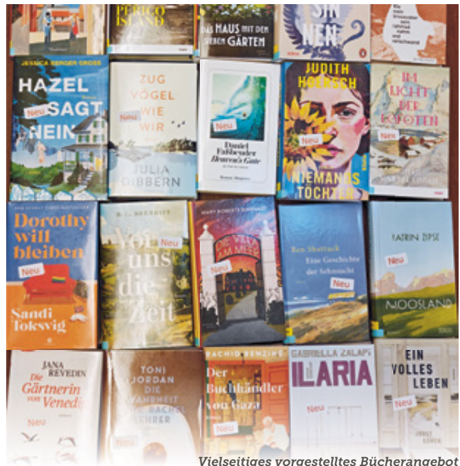
Vielseitiges vorgestelltes Bücherangebot