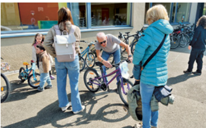
Ob da alles funktioniert?

Die 36. Velobörse der Grünen Partei beim Schulhaus Eichhölzli hatte diesmal ausgesprochenes Wetterglück. Entsprechend gross war der Ansturm und der Umlauf von Velos schliesslich rekordverdächtig: 34 fanden neue Besitzer, und ein Dutzend reist demnächst nach Afrika. Dass die vier Sorten Risotto aus den traditionellen Tonöfen ebenfalls guten Absatz fanden, bleibt da eine Randnotiz.