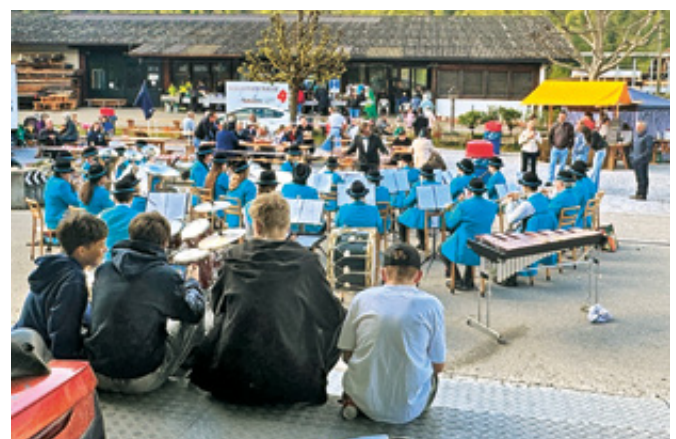
Geduldig warten die Jungen auf den Start des Chilbibetriebs.