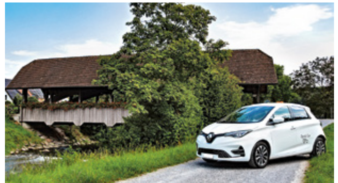
8207: Standort Emmerstrasse