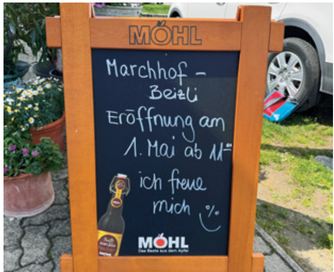
Der Countdown läuft: Am 1. Mai geht es los mit dem «Marchhof-Beizli».

Auf der Speisekarte stehen klassische, unkomplizierte Gerichte: Wurst-Käse-Salat, Thonsalat sowie Bratwürste vom Grill mit Pommes. Ergänzt wird das Angebot durch hausgemachte Kuchen und Glacé. Auch bei den Getränken setzt sie auf eine Mischung aus Bewährtem und Regionalem, etwa Wein aus Zweidlen sowie selbstgemachten Holunderblütensirup. Ein Prinzip ist für Denise Eggenschwiler zentral: «Ich kaufe nichts Fertiges ein, alles ist selbst-gemacht.»