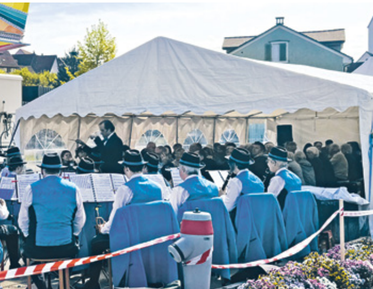
Die Musikgesellschaft umrahmte zunächst den Gottesdienst und spielte danach ein Platzkonzert.